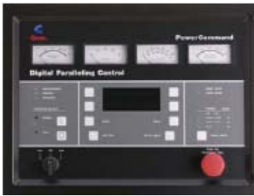
Aparecen características opcionales