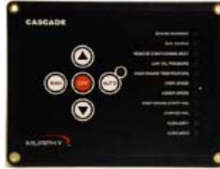
Controlador Cascade fácil de usar