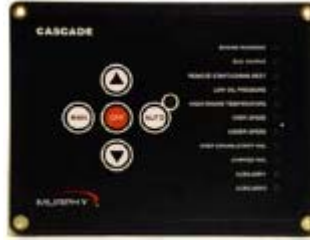
Controlador Cascada fácil de usar