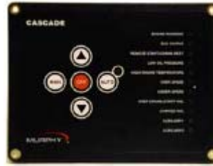
Controlador Cascade fácil de usar